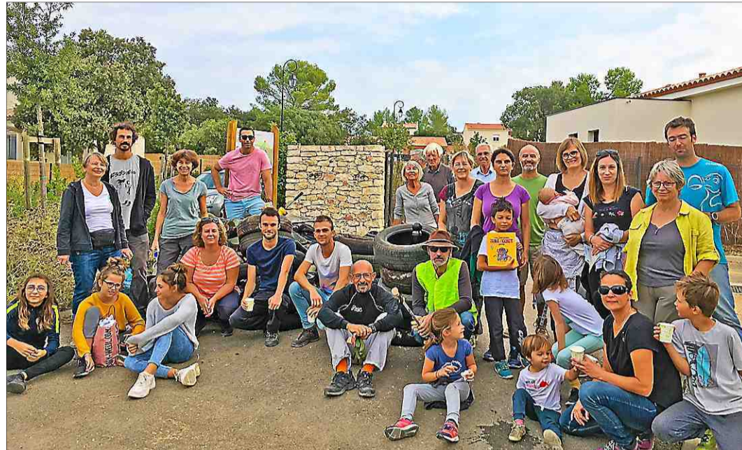
■ L'association Arbre a réussi à sensibiliser plus de vingt-cinq personnes pour l'opération.

L'opération "Nettoyons nos villages" a fait appel aux bénévoles.