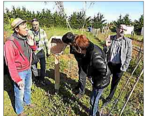
■ Matinée découverte des jardins partagés.

► Correspondant Midi Libre : 06 26 34 39 81