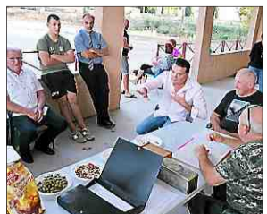
■ Des débats ont animé l'assemblée.

► Correspondant Midi Libre : 06 26 34 39 81